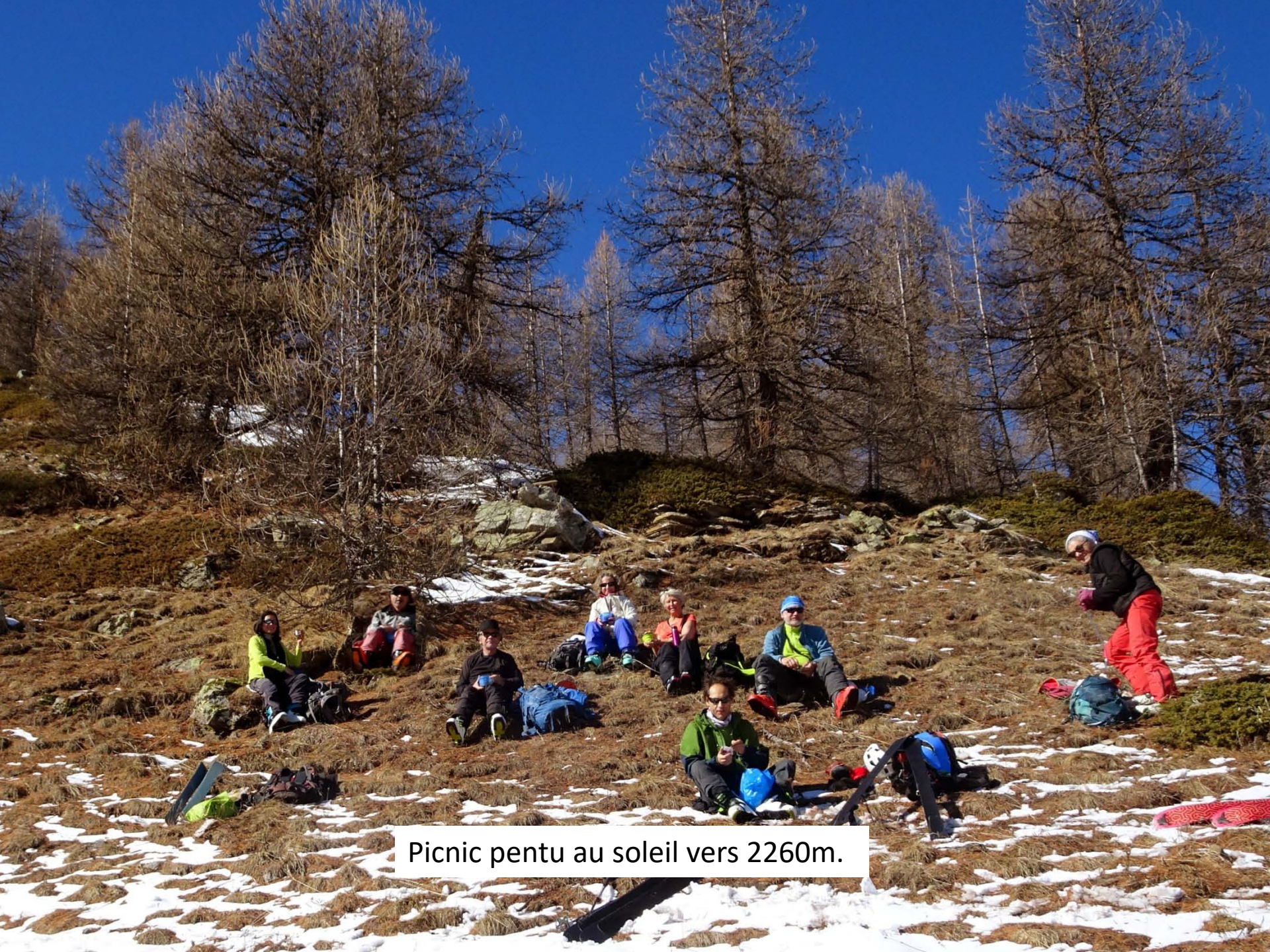
Picnic pentu au soleil vers 2260m.