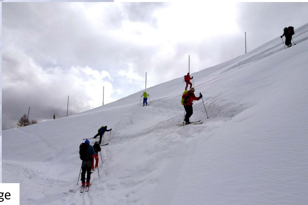
Exercice de conversions au Lac du Près Rouge